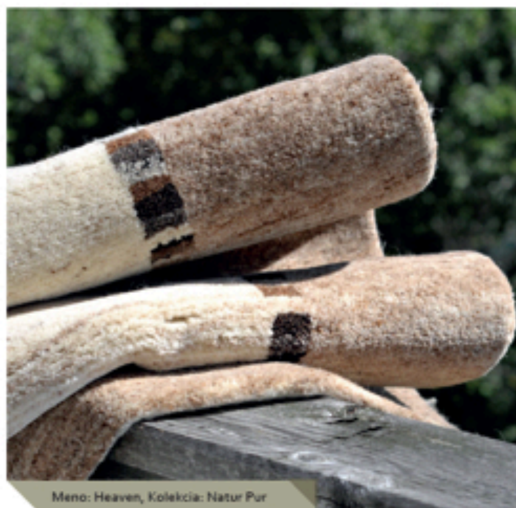
Meno: Heaven, Kolekcia: Natur Pur